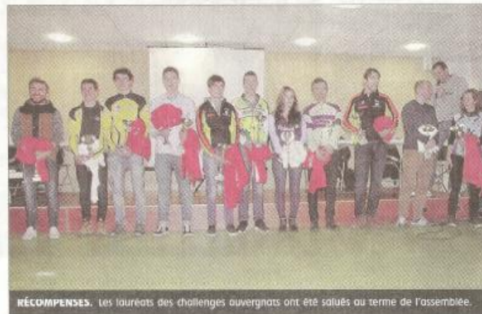
RÉCOMPENSES. Les lauréats des challenges auvergnats ont été salués au terme de l'assemblée.

Les temps forts ont été marqués par le champion-